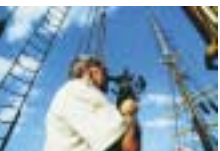
Ein Kapitän erkundet mit dem Sextanten die Position des Schiffes. P. Dellmann, Neustadt/Holst.

Seit früher Zeit hat auch der Mensch den Sonnenstand für seine Orientierung genutzt. Schon in einer unbekannt Stadt hilft gelegentlich ein Blick zum Himmel, um die Richtung zu erkennen, in die man sich wenden muss. Bevor der Kompass erfunden wurde, war die Navigation zu Lande oder zu Wasser nur durch die Sonne und die Sterne möglich. Besonders in der Seefahrt benutzte man den Sextanten. Mit ihm kann man aus dem Winkel der Sonne zum Horizont unter Berücksichtigung von Uhrzeit und Datum unmittelbar die Position erkennen, in der man sich gerade befindet.