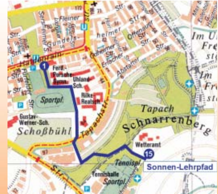
Kartengrundlage: Stadtmessungsamt Stuttgart

Lassen Sie sich einladen zu diesem Spaziergang, der je nach Gehtempo und Verweilzeit an den Standorten eineinhalb bis zwei Stunden Zeit in Anspruch nimmt.